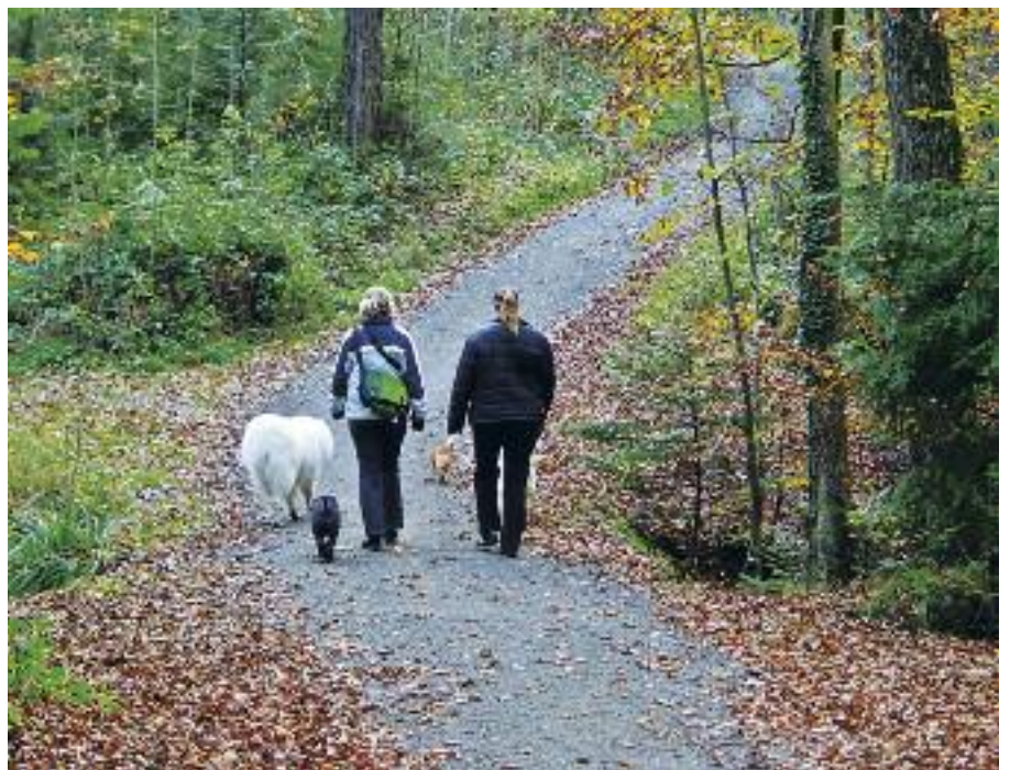
Der grösste Wert des Thalwiler Waldes liegt in seiner Bedeutung als Raum der Erholung.