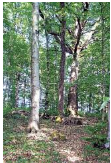
Ein vielseitiger Mischwald bietet viele Gelegenheiten zur Erholung.